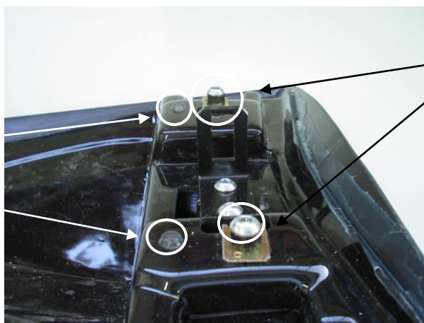
Position of spacers