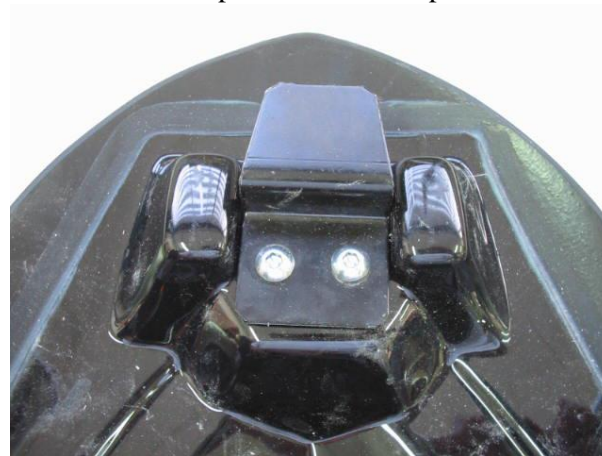
Position de la patte arrière du capot de selle