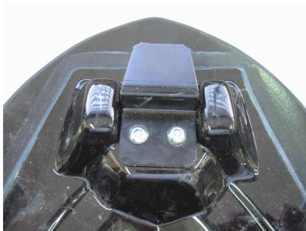
Location of rear bracket