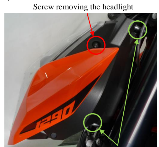
Screw removing the headlight