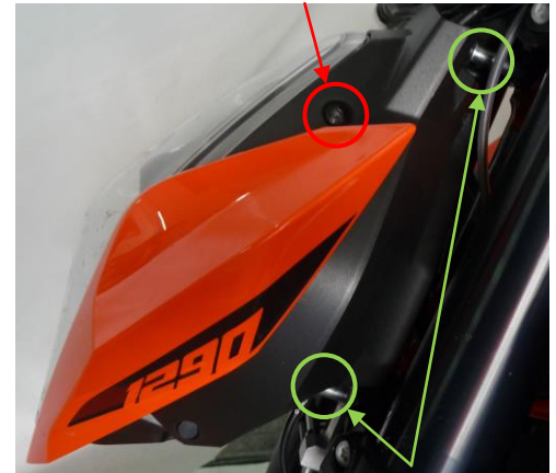
Entretoises filetées après remontage