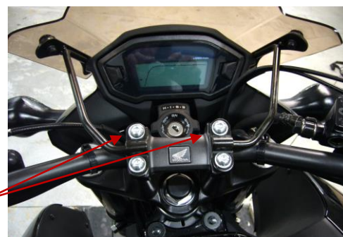
Photo 2 Vis à démonter et à remplacer